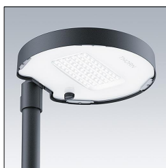
Lanterne lumineuse LED Amenity CT L 36L70-730 NR CL2 T60F ANT 96634298