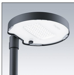
Lanterne lumineuse LED Amenity CT L 36L70-730 NR CL2 T60F ANT 96634298

La présente déclaration de produit environnemental (EPD) est basée selon les normes EN ISO 14025 et EN 15804 et décrit les impacts spécifiques environnementaux du produit mentionné. Cette déclaration fait suite également aux exigences spécifiques et concrètes du programme Institut Bauen und Umwelt e.V. (IBU) selon les règles de calcul des LCA et le contenu de l'EPD (de base) selon les instructions de PCR sous-jacentes (PCR: Règles de catégorie de produit) pour «Luminaires, lampes et composants pour luminaires» (Ref: IBU PCR Teil A et B). Le produit décrit sert d'unité déclarée. La déclaration inclut une description du produit, des informations sur la composition des matériaux, la production, le transport, la phase d'utilisation, l'élimination et le recyclage, ainsi que les résultats de l'évaluation du cycle de vie. Les EPD des produits de construction sont comparables uniquement si les valeurs sont calculées conformément au même PCR et des scénarios d'utilisation appropriés et obligatoires.