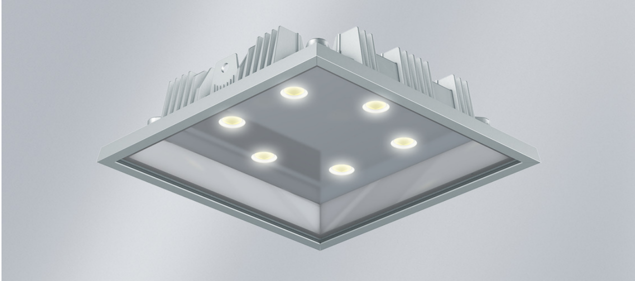
L'illustration peut différer