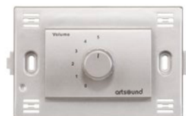
TNS-VOLST BTicino Light tech