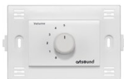
TNW-VOLST BTicino Light