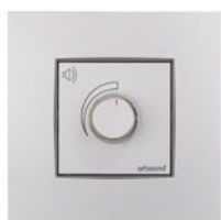
N-VOLST-121 gris sterling