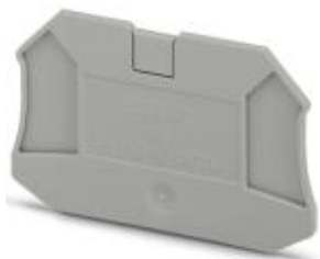
Flasque d'extrémité, Longueur: 64,4 mm, Largeur: 2,2 mm, Hauteur: 39,8 mm, Coloris: gris

Remarque : les données indiquées ici sont tirées du catalogue en ligne. Vous trouverez toutes les informations et données dans la documentation utilisateur. Les conditions générales d'utilisation pour les téléchargements sur Internet sont applicables. ( http://phoenixcontact.fr/download )