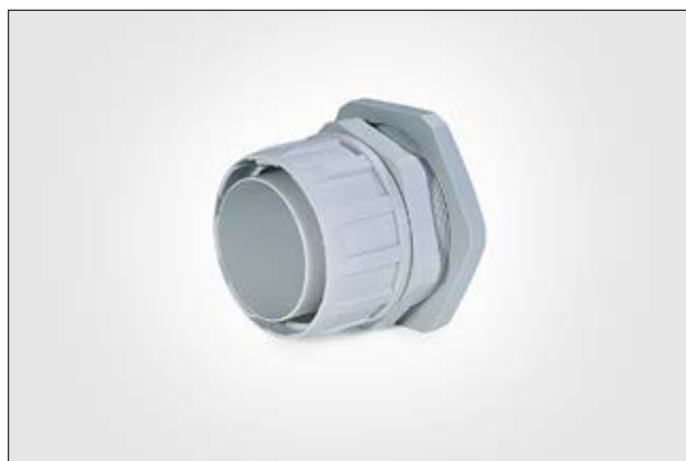
Raccord avec filetage tournant FG.