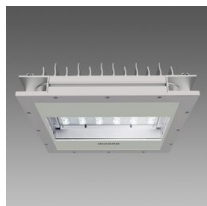
3262 Modoled - LED asymétrique