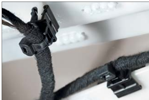
Lanières de la série EC en application.

Pour plus d'informations sur les matériaux, voir page 26.