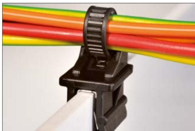
T50S0SEC12E - le faisceau de câbles est positionné perpendiculairement au bord de tôle.

L'insert métallique présent dans nos clips bord de tôle est un système à double griffe en acier C75S (DIN EN 10132-4). La rigidité de ces griffes permet un maintien très efficace, tout en ayant suffisamment de flexibilité pour s'adapter à différentes épaisseurs de support. Le revêtement chimique ou traitement de l'insert est à base de Zinc. Il n'y a aucune présence de Chrome VI dans le process de fabrication. Ainsi, nos lanières pour bords de tôle* répondent parfaitement aux exigences