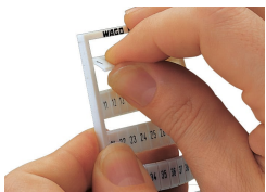
Détachement d'une bande de la carte WMB.