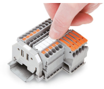
Encliquetage d'une bande de marquage WMB dans le logement de marquage