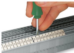
Encliquetage d'une bande de marquage WMB dans le logement de marquage