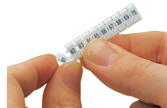
Détachement d'une étiquette de la bande de marquage WMB, pour les largeurs de bornes supérieures