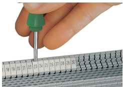
Encliquetage d'une bande de marquage WMB dans le logement de marquage du double porte-étiquettes