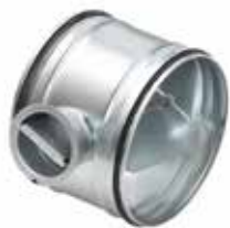
Registre RGP à joints

Le registre RGP permet d'équilibrer précisément un réseau circulaire. Les modèles à joints garantissent en plus un très faible taux de fuite.