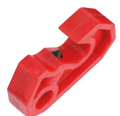
Solution universelle, s'applique à tous les disjoncteurs miniatures. Fixation simple et sûre à l'aide d'une vis intégrée au bloque disjoncteur.