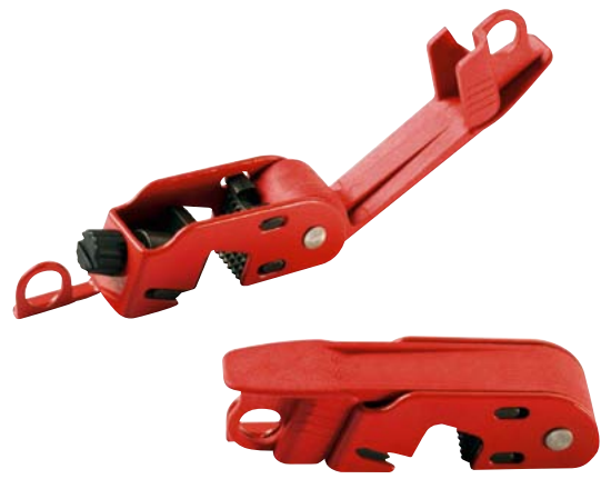
Pour disjoncteur à maneton haut et large.