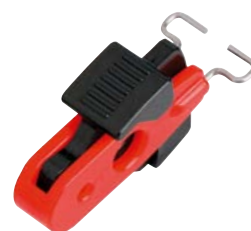
Pour disjoncteur muni de points de consignation sur la partie extérieure du maneton.