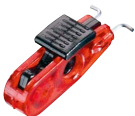
Pour disjoncteur à maneton < 11 mm