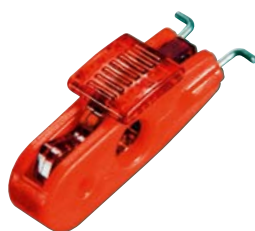
Pour disjoncteur à maneton >11 mm