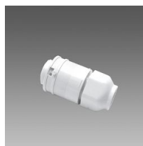
371 Fiche pour connectique rapide