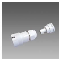
370 Raccord pour tube diam.20