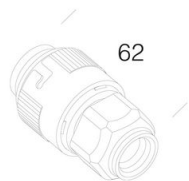
372 Prise pour connectique rapide