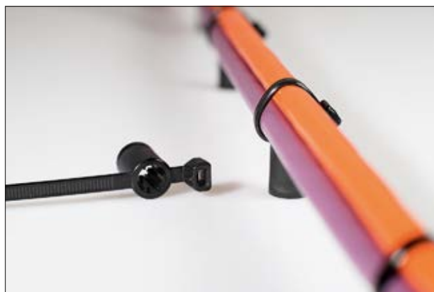
Lanières T50SSBS50TE et T50SSBS60TE, en application.