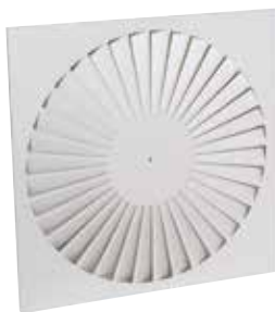
SF 786 F7 600x600 RAL9010-85%

Le SF 786 est un diffuseur carré réglable à jet hélicoïdal pour la diffusion d'air dans les locaux tertiaires.