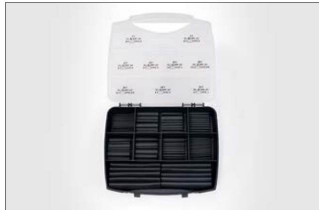
Shrinkkit 321 Basic - 220 pcs Assortiment de gaines thermorétractables 3:1.