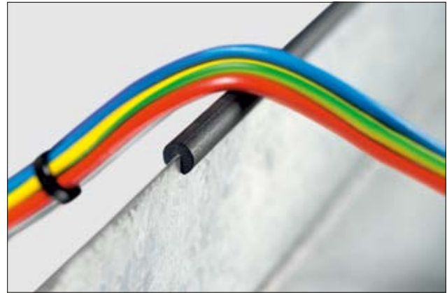
EdgeGuard : protection pour bords de tôles.