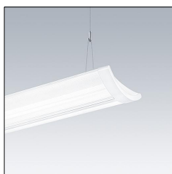
Luminaire suspendu LED IQ SUSP S LED2600-840 HFIX ML5 96628951