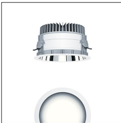
Plafonnier encastré à LED P-INF R200H LED2500-930 LDO AL WH 60818139

La présente déclaration de produit environnemental (EPD) est basée selon les normes EN ISO 14025 et EN 15804 et décrit les impacts spécifiques environnementaux du produit mentionné. Cette déclaration fait suite également aux exigences spécifiques et concrètes du programme Institut Bauen und Umwelt e.V. (IBU) selon les règles de calcul des LCA et le contenu de l'EPD (de base) selon les instructions de PCR sous-jacentes (PCR: Règles de catégorie de produit) pour «Luminaires, lampes et composants pour luminaires» (Ref: IBU PCR Teil A et B). Le produit décrit sert d'unité déclarée. La déclaration inclut une description du produit, des informations sur la composition des matériaux, la production, le transport, la phase d'utilisation, l'élimination et le recyclage, ainsi que les résultats de l'évaluation du cycle de vie. Les EPD des produits de construction sont comparables uniquement si les valeurs sont calculées conformément au même PCR et des scénarios d'utilisation appropriés et obligatoires.