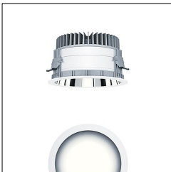
Plafonnier encastré à LED P-INF R200H LED2500-930 LDO AL WH 60818139