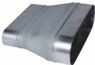
Réduction Concentrique Oblongue

La RCO permet de raccorder deux conduits oblongs de sections différentes.