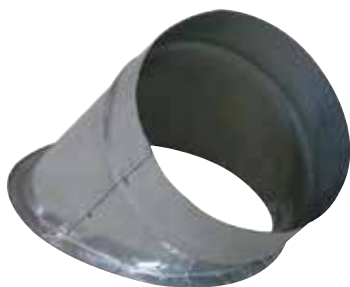
Piquage Oblique sur Plat 45°

Le piquage oblique sur plat permet de réaliser un piquage à 45° sur un conduit de type oblong ou rectangulaire galvanisé.