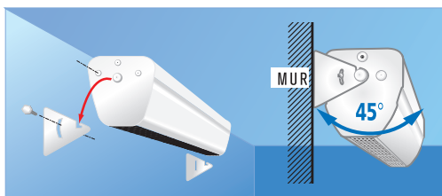
Pose au mur