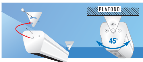
Pose au plafond

Notice d'utilisation à télécharger sur www.noirot.fr