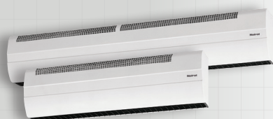
● Série longue