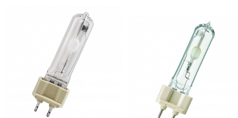
145921 CM-T G12 70W 830