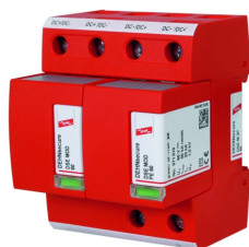
Illustrations sans engagement