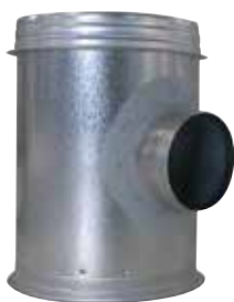
Caisson Piquage pour relevé d'étanchéité

Le caisson piquage pour relevé d'étanchéité permet de joindre et de rendre accessible le réseau collecteur vertical et le réseau horizontal.