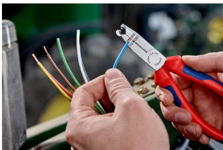
Trous de dénudage pour conducteurs 1,5 et 2,5 mm 2

Sous réserve de toute modification technique et erreur.