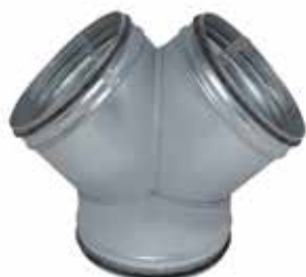
Culotte Simple 90° à joints

La CS 90° à joints permet d'assurer la confluence de 2 branches de réseau galvanisé à 90° l'une de l'autre tout en assurant une étanchéité classe C.