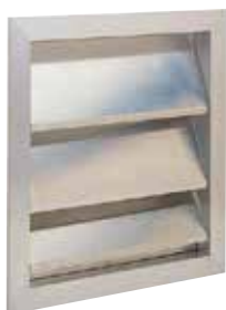
AVF75 400X400 V/DEPRESS

Le volet mural anti-retour AVF 75 permet la mise en dépression d'un local.