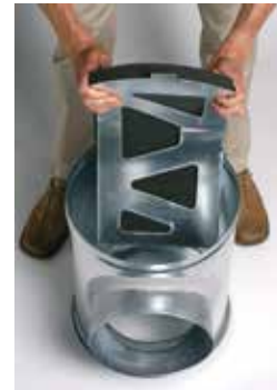
Installation du déflecteur acoustique et aéraulique dans le caisson piquage