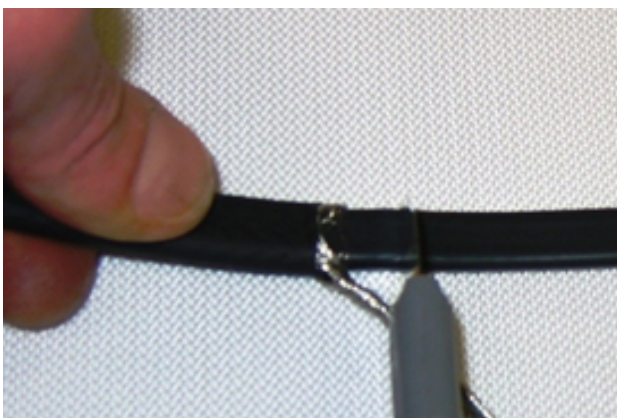
5 - Couper et dégager la couche protectrice HPDE sur 10mm