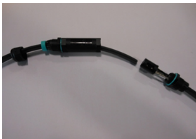
10 - Refaire la même opération pour l'autre côté