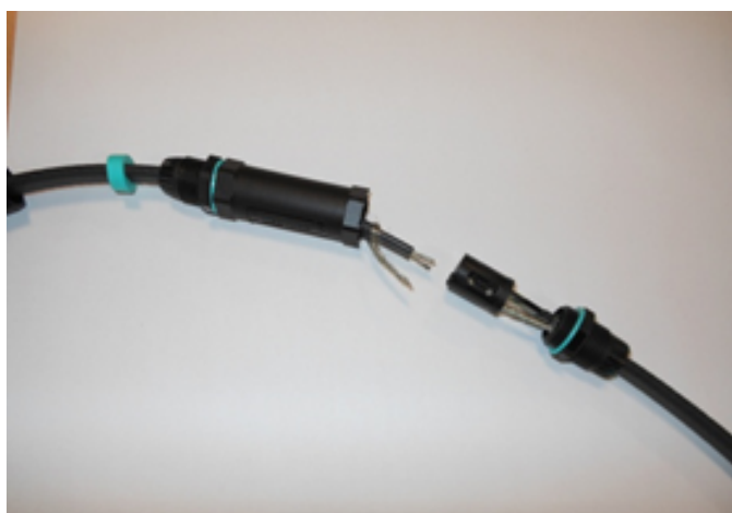
11 - Raccorder les 2 brins et le fil de masse en ayant inséré au préalable le corps cylindrique