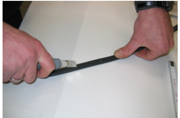
2 - Couper et dégager la gaine de protection sur 30mm de longueur