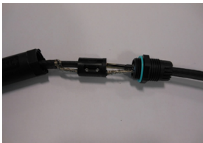
12 - Faire glisser le corps sur la presse-étoupe et visser