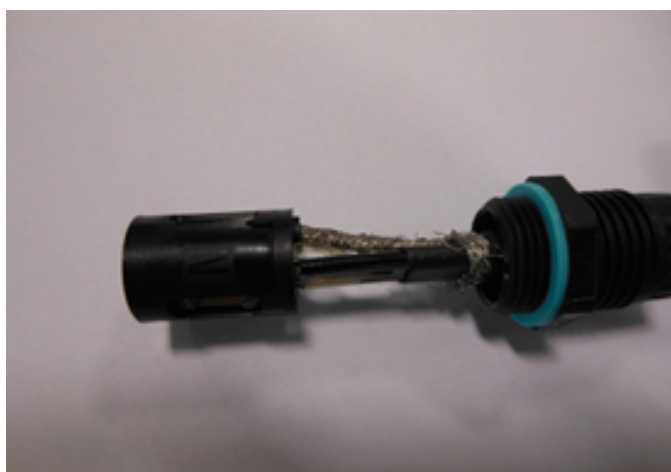
9 - Raccorder la tresse torsadée sur le bornier et chaque brin sur chacun des 2 borniers restants