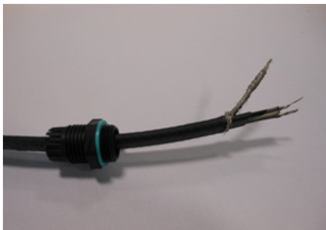
8 - Faire glisser la presse-étoupe