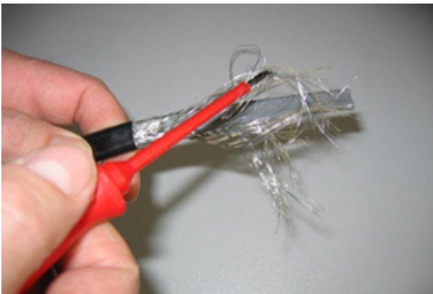
3 - Défaire les filaments de la tresse sur toute la longueur