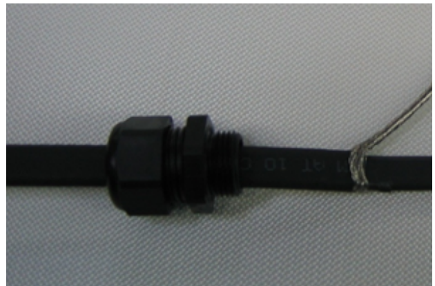
4 - Torsader les filaments pour réaliser le fil de mise à la masse