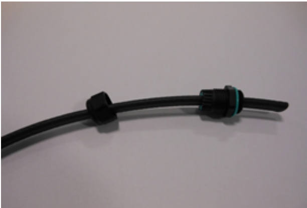
1 - Insérer le presse-étoupe sur le câble chauffant