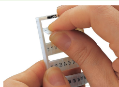
Détachement d'une bande de la carte WMB.