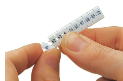
Détachement d'une étiquette de la bande de marquage WMB, pour les largeurs de bornes supérieures