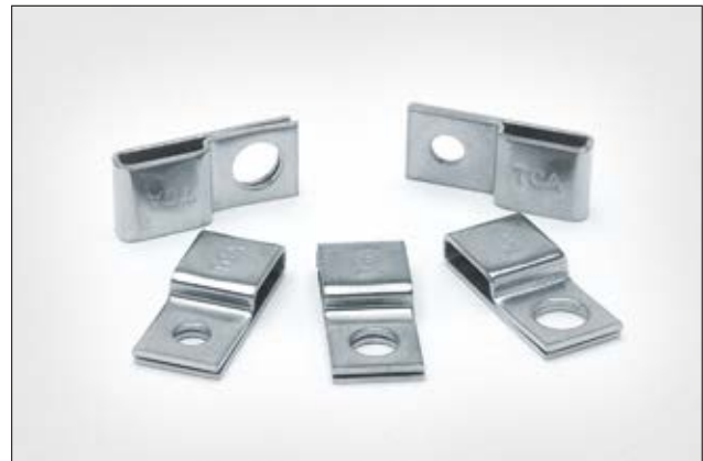
Embases de fixation en acier inoxydable de la série SSPC.