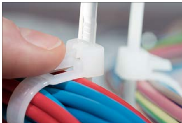
Colliers réouvrables de la série REL en application.