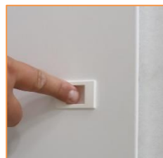
Fermeture par loquet