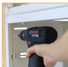
Visser les pattes du cadre sur le bac