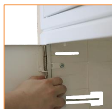
Insérer la porte en faisant pression sur la charnière à ressort