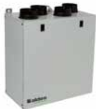
InspirAIR® Top 210

Les petits logements ont aussi le droit à l'expertise double flux Aldes