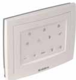
Télécommande filaire InspirAIR® Top 210