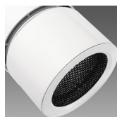
Diffuseur à ventelles