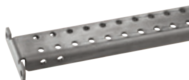
0 347 43