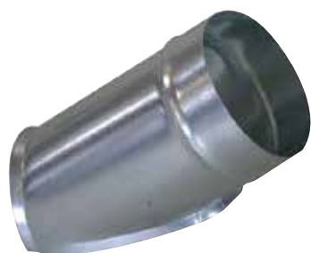
Piquage Oblique Circulaire 45°

Le piquage oblique circulaire permet de réaliser un piquage à 45° sur un conduit circulaire galvanisé.