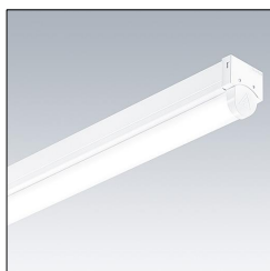
Plafonnier LED POPPACK LED 3000-840 HFI L1200 96631540

La présente déclaration de produit environnemental (EPD) est basée selon les normes EN ISO 14025 et EN 15804 et décrit les impacts spécifiques environnementaux du produit mentionné. Cette déclaration fait suite également aux exigences spécifiques et concrètes du programme Institut Bauen und Umwelt e.V. (IBU) selon les règles de calcul des LCA et le contenu de l'EPD (de base) selon les instructions de PCR sous-jacentes (PCR: Règles de catégorie de produit) pour «Luminaires, lampes et composants pour luminaires» (Ref: IBU PCR Teil A et B). Le produit décrit sert d'unité déclarée. La déclaration inclut une description du produit, des informations sur la composition des matériaux, la production, le transport, la phase d'utilisation, l'élimination et le recyclage, ainsi que les résultats de l'évaluation du cycle de vie. Les EPD des produits de construction sont comparables uniquement si les valeurs sont calculées conformément au même PCR et des scénarios d'utilisation appropriés et obligatoires.