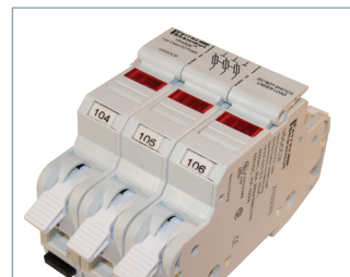
Système de marqueurs WMB