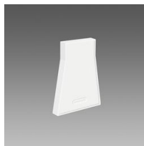
Embout de fermeture 1 - Sintesi