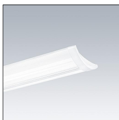
Plafonnier LED IQ SURF L LED4900-840 HFIX 96628947