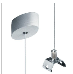
Susp. à câble + cache-piton SLOT2/SLOIN/EQL ASI2 SR E-L 22157369