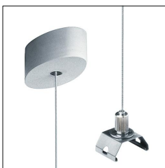
Susp. à câble + cache-piton SLOT2/SLOIN/EQL ASI2 SR E-L 22157369

La présente déclaration de produit environnemental (EPD) est basée selon les normes EN ISO 14025 et EN 15804 et décrit les impacts spécifiques environnementaux du produit mentionné. Cette déclaration fait suite également aux exigences spécifiques et concrètes du programme Institut Bauen und Umwelt e.V. (IBU) selon les règles de calcul des LCA et le contenu de l'EPD (de base) selon les instructions de PCR sous-jacentes (PCR: Règles de catégorie de produit) pour «Luminaires, lampes et composants pour luminaires» (Ref: IBU PCR Teil A et B). Le produit décrit sert d'unité déclarée. La déclaration inclut une description du produit, des informations sur la composition des matériaux, la production, le transport, la phase d'utilisation, l'élimination et le recyclage, ainsi que les résultats de l'évaluation du cycle de vie. Les EPD des produits de construction sont comparables uniquement si les valeurs sont calculées conformément au même PCR et des scénarios d'utilisation appropriés et obligatoires.