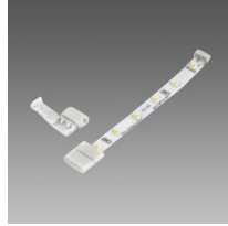
Connecteur pour ligne continue - Strip LED IP20