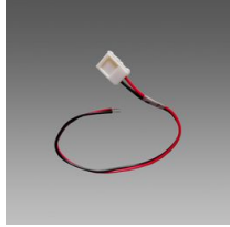
Connecteur avec câble - Strip LED IP20