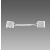
Connecteur pour angle - Strip LED IP20