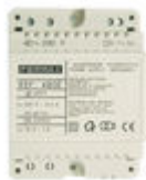
F04802 ALIMENTATION DIN4 230VAC/12VAC-1A