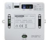
F09444 INTERFACE CAMÉRA DUOX PLUS