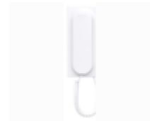
F03443 COMBINÉ VEO AVEC BOUCLE AUDITIVE