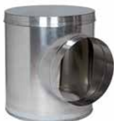
Caisson Piquage Acoustique et Aéraulique en aluminium