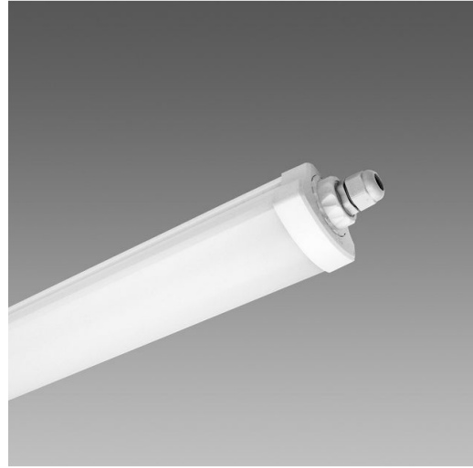
1784 Roda Basic