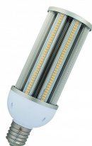
80100036301 LED Corn HOL E40 54W 7600lm 4000K