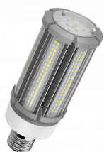
145945 LED Corn Compact E40 54W 8200lm 6500K 100V-260V