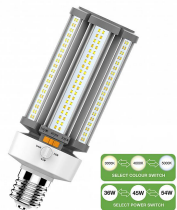
145790 LED Corn Switch E40 36W-54W 4800-7800lm 3000K-5000K