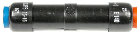
MJPB 25-16 CG

Mise en oeuvre : sertissage par rétreint hexagonal avec matrice E140.