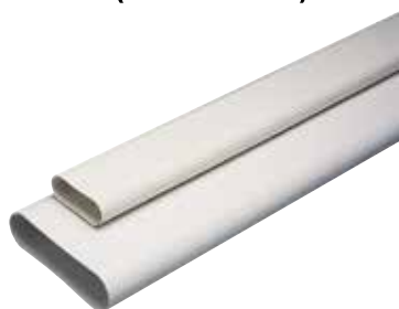
Barre de 1m Minigainé

Conduits rigides plastique MINIGAINÉ extra-plats pour réseau de ventilation en maison individuelle.