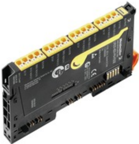
Illustration du produit, Similaire à l'illustration