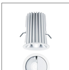
Plafonnier encastré à LED DIAMO R68 1200-930 SWI WW-DAL WH 60816980

La présente déclaration de produit environnemental (EPD) est basée selon les normes EN ISO 14025 et EN 15804 et décrit les impacts spécifiques environnementaux du produit mentionné. Cette déclaration fait suite également aux exigences spécifiques et concrètes du programme Institut Bauen und Umwelt e.V. (IBU) selon les règles de calcul des LCA et le contenu de l'EPD (de base) selon les instructions de PCR sous-jacentes (PCR: Règles de catégorie de produit) pour «Luminaires, lampes et composants pour luminaires» (Ref: IBU PCR Teil A et B). Le produit décrit sert d'unité déclarée. La déclaration inclut une description du produit, des informations sur la composition des matériaux, la production, le transport, la phase d'utilisation, l'élimination et le recyclage, ainsi que les résultats de l'évaluation du cycle de vie. Elle est vérifiée par un organisme indépendant indépendamment conformément à la norme EN ISO 14025. Les EPD des produits de construction sont comparables uniquement si les valeurs sont calculées conformément au même PCR et des scénarios d'utilisation appropriés et obligatoires.