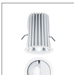
Plafonnier encastré à LED DIAMO R68 1200-930 SWI WW-DAL WH 60816980